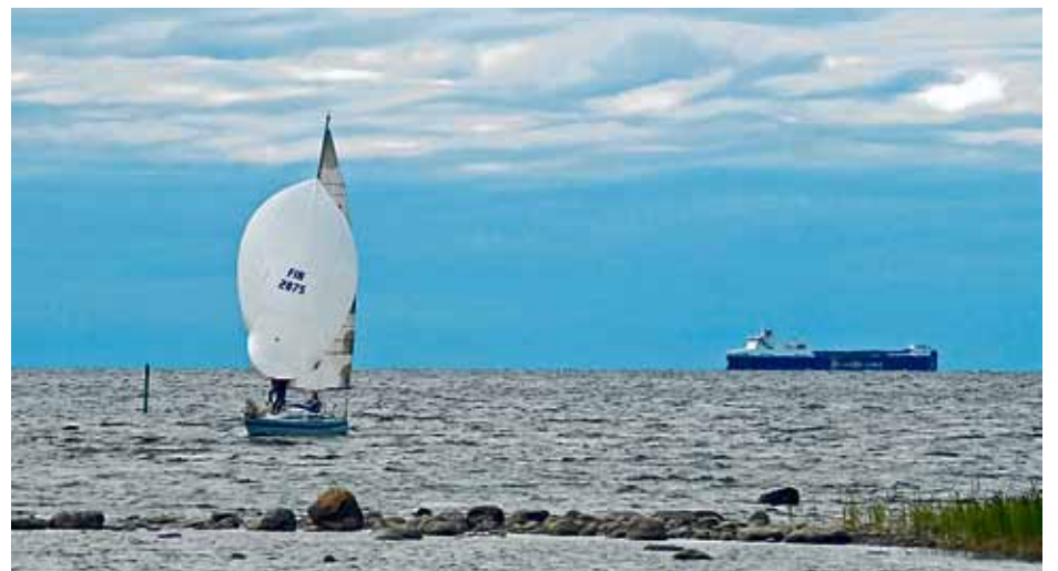
Iin kunta laajasti tarkasteluna on varsin ihanaa seutua luontonsa puolesta. Iitä halkoo kolme jokea ja merenrantaa on noin 50 kilometriä. Iin upea ja puhdas luonto, Perämeri ja lähisaaret, jokialueet, kalaisat vedet sekä monipuoliset tapahtumat tarjoavat erinomaisen ympäristön lomailuun ja erilaisiin aktiviteetteihin. Ii on vapaa-ajan asumisen suosittu kohde.