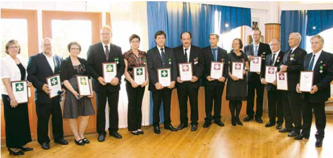
Merkkipäiväjuhlassa huomioitiin pitkään toimineita yrittäjiä yrittäjäristein.

Kuivaniemen yrittäjät kiittävät lahjoittajia koululaisten stipendiraaston kartuttamisesta! Samoin kiitos kaikille juhlassa esiintyneille ja järjestelyyn osallistuneille, juhla onnistui hienosti!