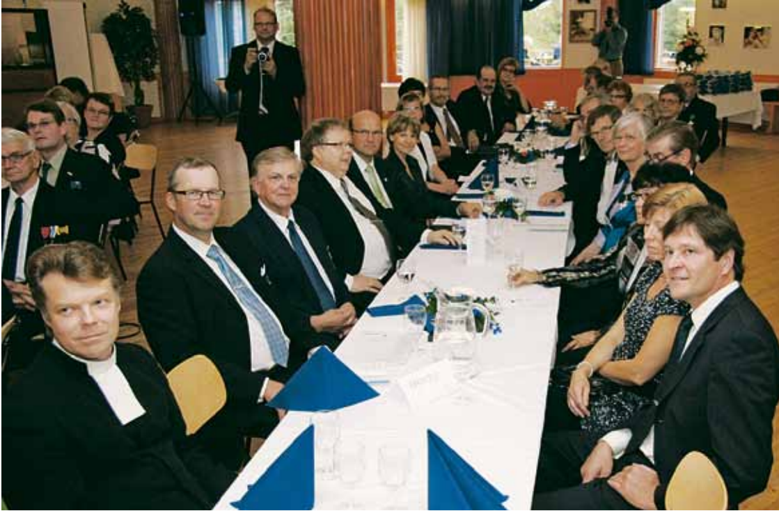
Kuivaniemen Yrittäjien juhla oli sekä juhlava että tunnelmaltaan vapaa.