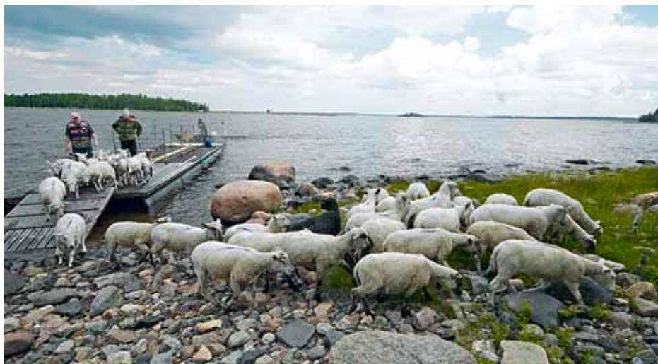
Lampaat rantautuvat Satakarin saareen. Röyttä ja sen vierellä oleva Satakari kuuluvat Metsähallituksen ylläpitämään ja hoitamaan Perämeren saaret-Natura-alueeseen. Satakari on erotettu aidalla kahdeksi toisistaan poikkeavaksi luontotyyppiä. Toinen puoli saaresta on luonnon tilassa, toinen osa luonnontuotetta, jota hoidetaan kesäisin saareen tuotavien lampaiden avulla.