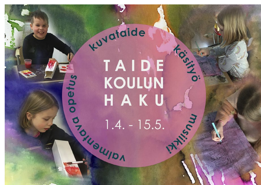
Kuvassa on Pohjois-Iin ja Jakun koulujen kuvataideryhmien oppilaita.

Taidekoulun kuvataideopetuksessa pääsee tutustumaan kuvataiteeseen laaja-alaisesti arkkitehtuurikasvatuksesta muotoiluun ja taidegraafikasta kolmiulotteiseen tai-