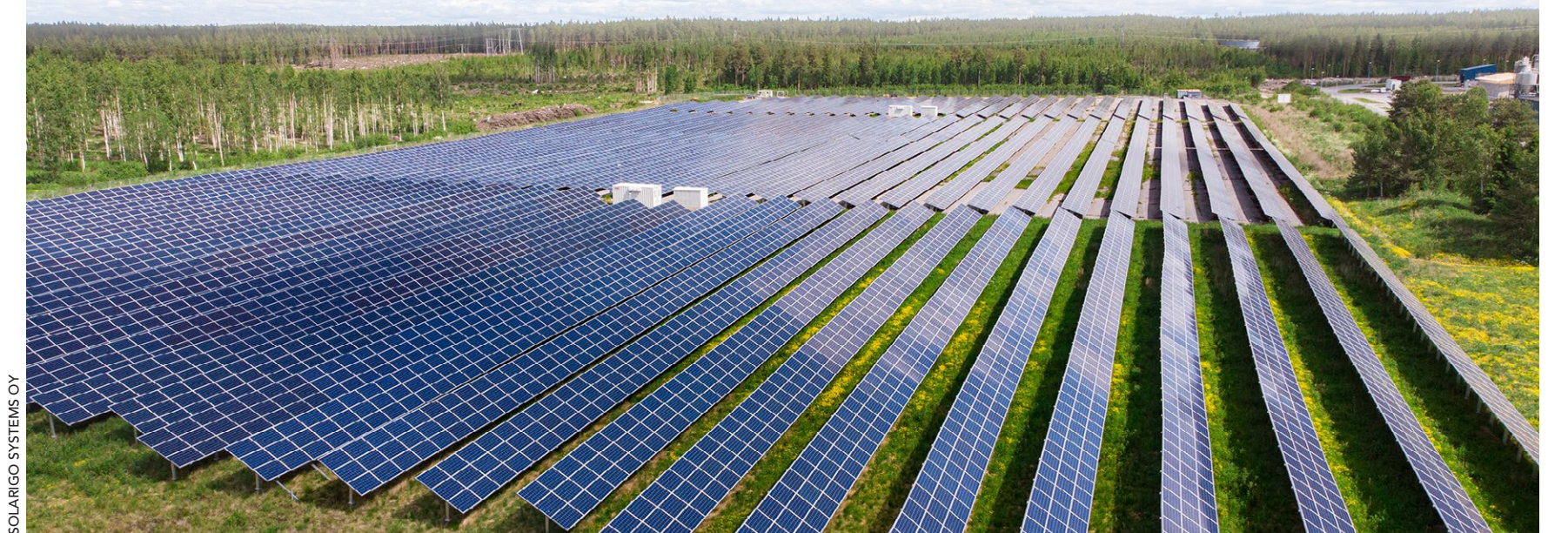
Atrian Nurmon tehtaan yhteydessä oleva aurinkopuisto (noin 9 000 megawattia) on kokoluokaltaan tällä hetkellä Suomen suurin. Kennoja on noin 31 000 kpl.