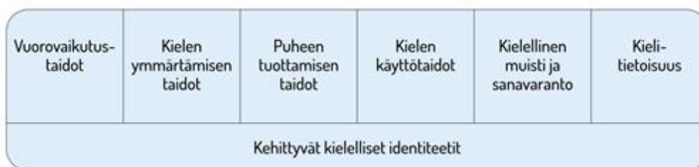
KUVIO 1. LASTEN KIELEN KEHITYKSEN KESKEISET OSA-ALUEET ESIOPETUKSESSA

Esiopetuksessa tuetaan jokaisen lapsen opetuskielen taitojen kehittymistä. Opetuksessa otetaan huomioon, että lapset kasvavat erilaisissa kielellisissä ympäristöissä ja että he voivat samaan aikaan omaksua useita eri kieliä. Kotien tavat käyttää kieltä ja olla vuorovaikutuksessa vaihtelevat, ja kodeissa voidaan puhua useita kieliä. Kielellistä ja kulttuurista moninaisuutta tehdään esiopetuksessa näkyväksi yhteistyössä huoltajien kanssa. Tämä osaltaan tukee lasten kielellisten identiteettien kehittymistä. Kielelliseen ja kulttuuriseen moninaisuuteen liittyviä tarkentavia näkökulmia esiopetuksessa käsitellään luvussa 4.5. Kielen oppimisen kannalta on tärkeää tiedostaa, että saman ikäiset lapset voivat olla eri vaiheissa kielen kehityksen eri osa-alueilla. Lasten kielelliset identiteetit (kuvio 1) kehittyvät, kun heitä ohjataan ja tuetaan kielellisten taitojen ja valmiuksien keskeisillä osa-alueilla.