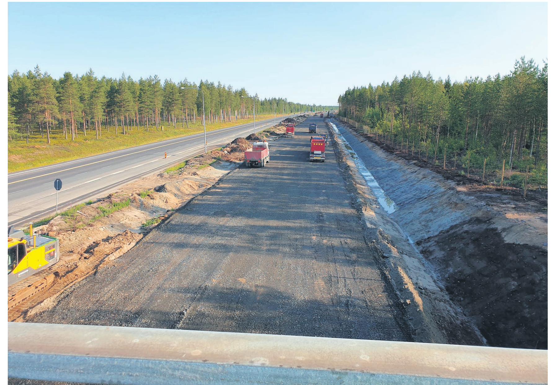
Moottoritieosuus Kello-Räinänperä, heinäkuu 2019.