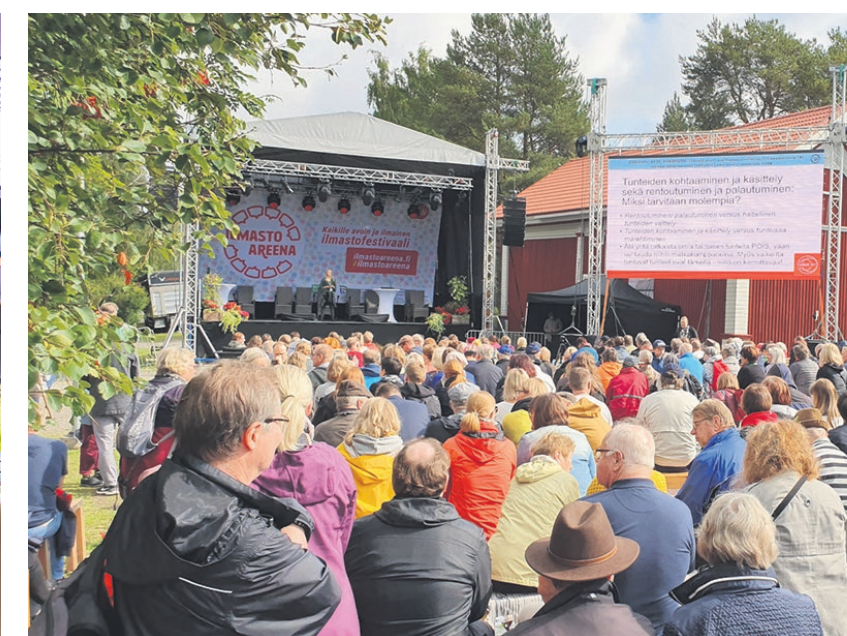
IlmastoAreena keräsi runsaasti kävijöitä vuonna 2019.