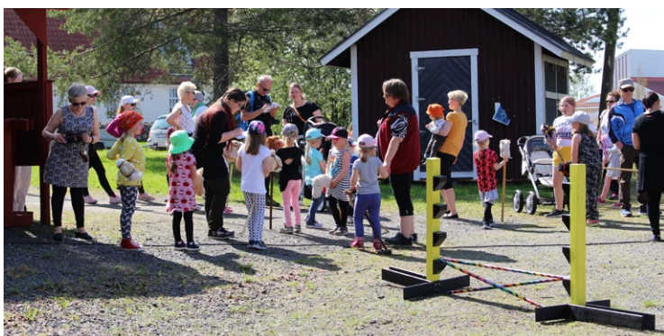
Museopäivänä 3.7. järjestetään taas leikkimieliset kepparikisat. Kuva kesän 2019 kepparikisoista.

Kesäolohuoneessa voit lukea päivän lehdet, saada tietoa Iistä ja tutustua Iin historiaan valokuvien ja kirjavinkein. Kesäolohuone on avoinna kirjaston kesäaukioloaikoina sekä lauantaisin klo 12–15.