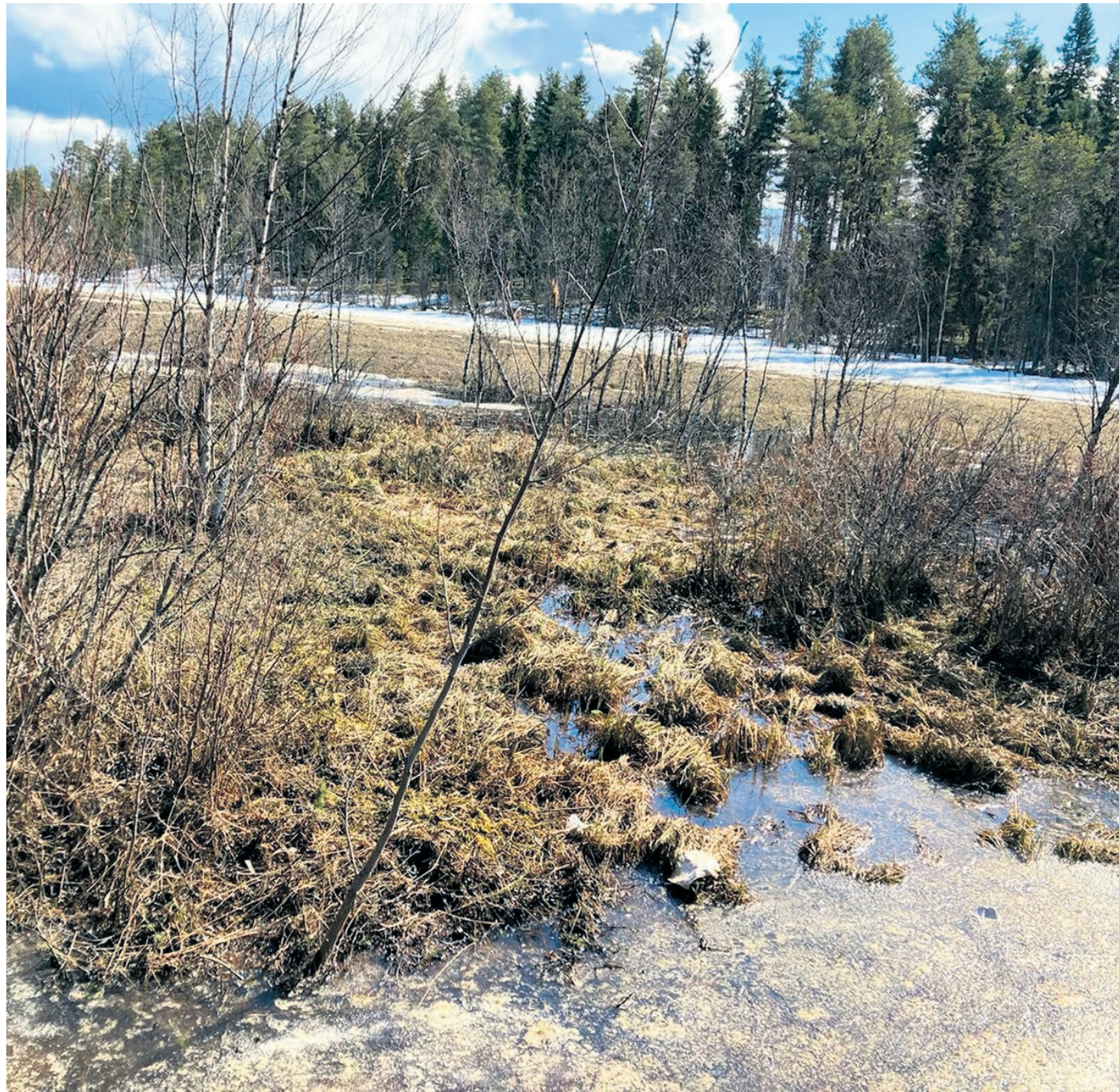
Sikalanjärven suoaluetta ympäröi vanha ja jylhä puusto.

Sikalanjärven luontopolun rakentaminen alkaa kesällä. Luontopolku valmistuu käyttöön vuoden 2021 loppuun mennessä.