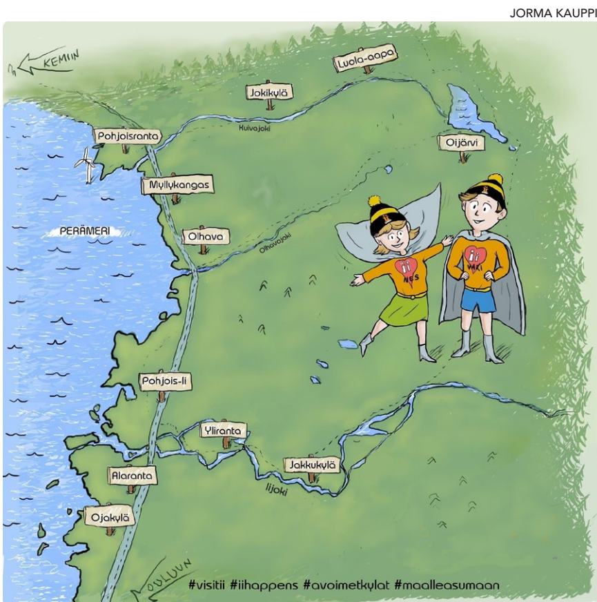
Iin kyllien neuvottelukunnan kylät ovat: Oijärvi, Luola-aapa, Jokikylä, Pohjoisranta, Myllykangas, Olhavan seutu, Pohjois-Ii, Yliranta, Jakkukylä, Alaranta ja Ojakylä.

www.sanaris.fi/ laadinta Teemu Pallonen, toteutus Heli Kärkkäinen