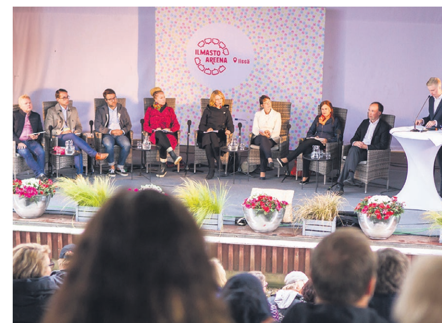
Puoluejohdon tentti veti Huilingin katsomon ja viheralueet täyteen kuuntelijoita.

- Jotkut festivaalikävijät sanoivat ensimmäisellä kerralla, että tähän on aivan tällainen pilottettu timantti.