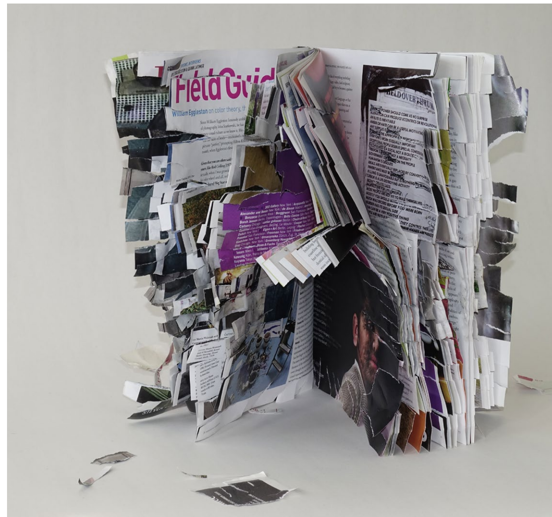
Kesänäyttely on avoinna 4.6.–31.7. ti–pe klo 12–17 ja la klo 11–16 KulttuuriKauppilassa (Kauppilantie 15, Ii). Näyttelyyn on vapaa pääsy.